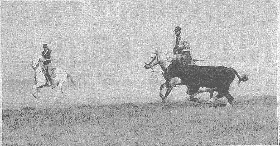
Le tri des taureaux et les ferrades sont des habitudes pour les gardians de la manade Devaux

Loïc Devaux a intégré la manade en 2005 et a acheté du bétail d'origine Bilhau. Lui aussi passionné et respectueux des traditions, il a formé une nouvelle équipe de gardians, tous âgés de 17 à 27 ans, autant dire une équipe jeune et dynamique qui veut satisfaire les besoins des moindres passionnés de taureaux. A l'affût de sensations fortes, ils font les quatre